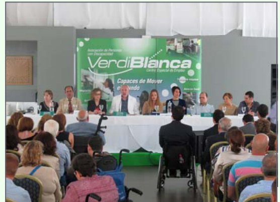
Asamblea de 2016, celebrada en el Club de Natación Almería, con masiva presencia de soci@s y plantilla, donde se eligió nueva Junta Directiva.

Un año más deseamos compartir con vosotr@s la gran fiesta de la primavera de Verdiblanca: nuestras Asambleas Extraordinaria y Ordinaria de asociad@s. En ellas la presencia de nuestra plantilla es fundamental, ya que trataremos temas tan importantes como la modificación de los estatutos de la entidad, la aprobación del Reglamento Electoral y la ampliación de capital de nuestra Sociedad Limitada Única, Verdiblanca de Medio Ambiente. Durante la Asamblea Ordinaria daremos cuenta de la gestión económica y de las múltiples actividades del Área de Gestión Social y Corporativa del pasado año 2016. También se expondrán los proyectos de la Junta Directiva para este 2017 en las diferentes áreas para mejorar la calidad de vida de las personas con discapacidad y de los más de 500 trabajador@s que prestan sus servicios en Almería, Granada y Sevilla. La cita, como en años anteriores, será en el Club de Natación Almería, (al final del recinto ferial) el próximo viernes 19 de mayo, desde las 18:30 horas. También habrá un aperitivo y zona de ocio infantil.