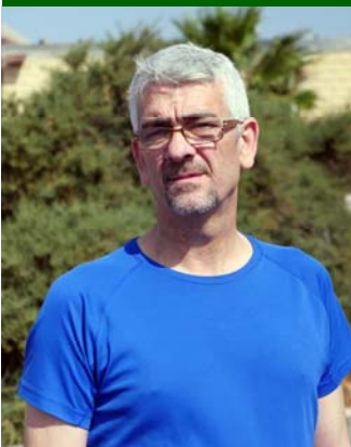
Salir al campo con su familia es una de sus pasiones.