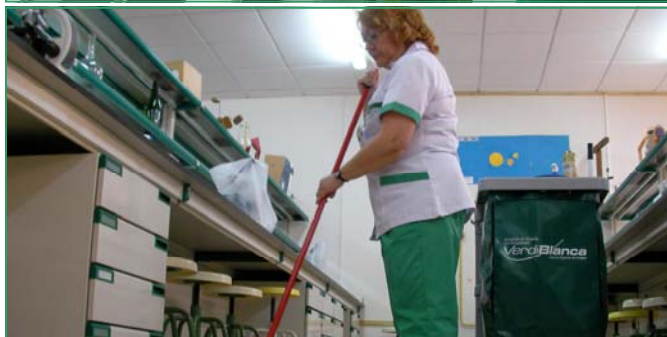
Incremento en las tablas salariales para los próximos cuatro años.