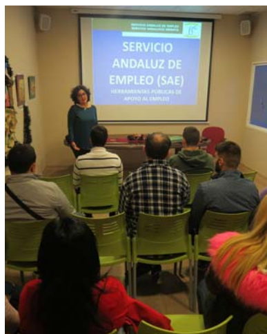
Charla sobre empleo en Verdiblanca.

Verdiblanca es consciente de las necesidades y preocupaciones personales de la plantilla, por lo que a lo largo de 2017 hemos planificado una serie de acciones informativas y formativas, tanto para trabajador@s como para su entorno familiar, dentro de las medidas del nuevo Plan de Igualdad de Género 2017-2020. El objetivo es que la plantilla se beneficie también de servicios que ofrece nuestra organización, como el asesoramiento jurídico, orientación laboral, atención social, y asesoramiento en la búsqueda