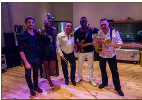
Carlene y su banda ya está ultimando los arreglos del concierto durante los ensayos diarios.

La prodigiosa voz de la cantante británica Carlene Graham va a dar su primer gran concierto en solitario en la provincia de Almería. Y lo hará de manera solidaria para el Plan de Emergencia de Asistencia Domiciliaria de Verdiblanca. Repetiremos así la exitosa experiencia del pasado año de realizar un concierto benéfico. En esta ocasión el evento musical se celebrará el 31 de enero, en el Auditorio de Roquetas de Mar, al que se sumarán otros artistas invitados.