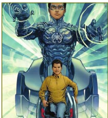
La discapacidad, a través de cómic, llegará a jóvenes almerienses.

De entre todos los presentados, el jurado especializado elegirá a los ganadores, cuyo premio será la publicación de sus historietas en una edición limitada de 1.000 ejemplares, repartidos en cinco centros docentes de la provincia donde serán expuestas sus obras e impartirán una charla.