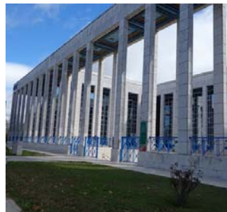
Edificio Prensa Norte en Sevilla.

Dirección General de Fondos Europeos. Al ser un centro reformado, tras varios años cerrado, permitirá la incorporación de 4 puestos nuevos para personas con discapacidad en la categoría de limpiador.