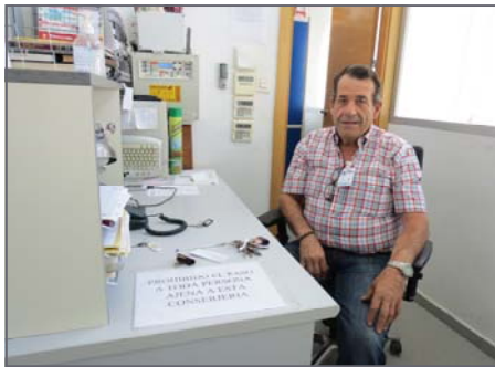
El controlador de accesos del Centro de Acogida.

Uno de los objetivos prioritarios de la Junta Directiva de Verdiblanca es la incorporación y consolidación de nuevas líneas de negocio para incrementar nuestra actividad empresarial y poder crear nuevos puestos de trabajo para personas con diversidad funcional. De esta forma, tras presentarnos a concurso público junto a otras empresas, finalmente hemos sido adjudicatarios del contrato de control de acceso a diversos edificios