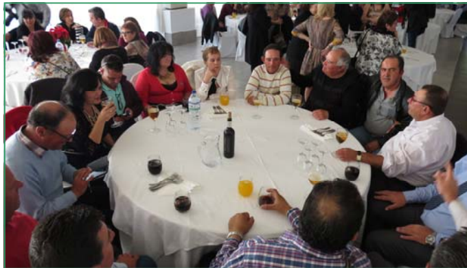
Momentos de la celebración del encuentro navideño en 2015 en el Club de Natación Almería.