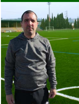
El fútbol es una de las aficiones que comparte con su hijo.