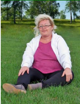
Disfrutar del campo y la sierra son dos de sus aficiones.