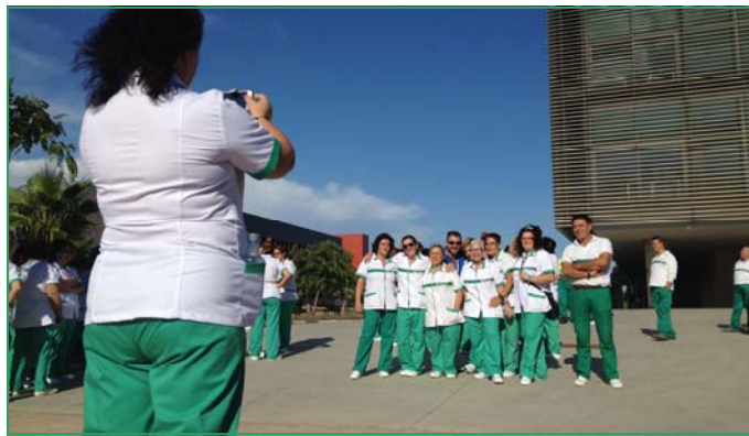
Plantilla de Verdiblanca en uno de los actos de reivindicación.

Los CEE esperamos que la Junta cumpla con otras tres reivindicaciones pendientes: 1) El pago de los incentivos correspondientes a diciembre de 2014, y todo el año 2015 antes de que acabe el presente ejercicio. 2) Que se pague la deuda a los CEE de Málaga y Sevilla