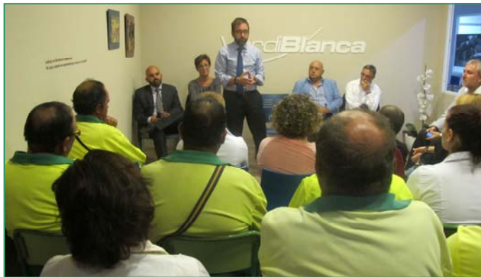
El Director General de Políticas Activas de Empleo en su visita a Verdiblanca