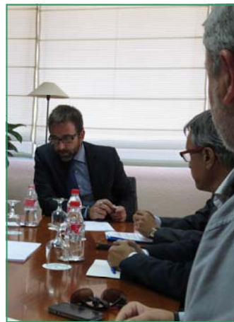
En una reunión previa anunció suficiente presupuesto para 2014 y 2015

grupo de trabajo para mejorar el futuro de los contratos en nuestro colectivo. Y adelantó que será inmediata la publicación de la nueva Orden de ayudas al mantenimiento de puestos de trabajo en CEE, paralizada desde febrero. Ya quedan despejadas las incertidumbres que nos ha llevado a lanzar una campaña divulgativa; aunque quedamos expectantes a los siguientes pasos de la Junta para posibles acciones.