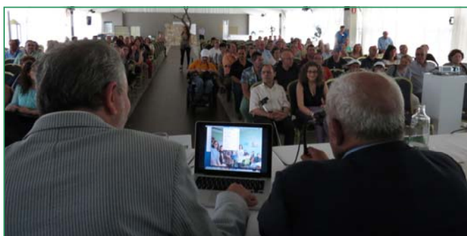
Las instalaciones del Club de Natación alojarán de nuevo las Asambleas.

La cita de esta 'Fiesta de la Primavera 2014' será el próximo sábado 26 de abril, desde las 11 de la mañana hasta las 6 de la tarde. Contaremos con música de baile, homenaje a quienes se han jubilado el último año, nombramiento de soci@ de honor, animación