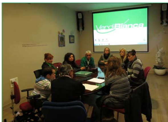
La nueva medida del Gobierno sobre los conceptos cotizables, que se modifican en las nóminas, se expuso en una reunión a los miembros del Comité de Empresa para informar sobre estos cambios.

pasado año con carácter retroactivo, con las nóminas de diciembre ya elaboradas. Por tanto, en la nómina de enero se aplicará la deducción por la aportación de la Seguridad Social y el descuento de lo cobrado de más en el mes de diciembre.