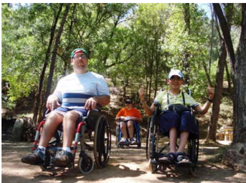
L@s soci@s de Verdiblanca con sus cuotas al día podrán participar en estas vacaciones.

conocéis alguna granja o huerto turístico, o bosques donde ver por la noche las estrellas, y así satisfacer vuestros deseos. Todo para conseguir que participéis en esta actividad recreativa, cultural y medioambiental.