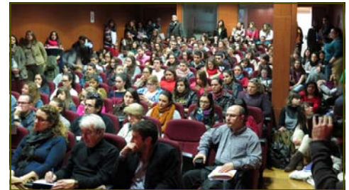
Una treintena de directivos y plantilla de Verdiblanca acude a los talleres de la recién creada Escuela de Observadores Estratégicos, en las que han