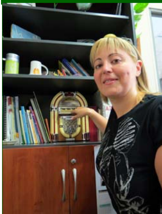
'Carmencilla' recorre el dial en busca de buena música.