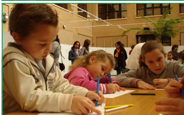
Hijos e hijas de la plantilla participan en actividades de Verdiblanca.

Pueden pedirlos los miembros de la plantilla con contrato fijo o dos años de antigüedad cuyos hijos o hijas estén cursando estu-