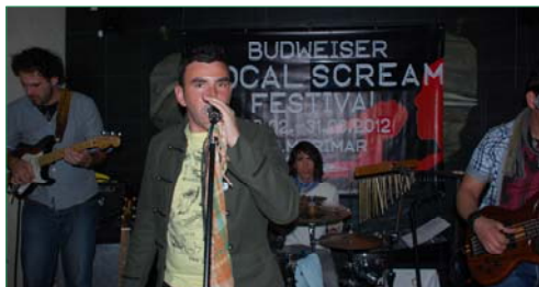
El grupo 'Apol' interpretará temas españoles actuales y consolidados de artistas superconocidos.

Una Fiesta de Primavera con actuación en directo de un grupo musical, animación para soci@s infantiles, hij@s y niet@s de nuestra plantilla y asociad@s, homenaje a quienes se han jubilado este último año y un aperitivo para acompañar este encuentro de la gran familia de Verdiblanca.