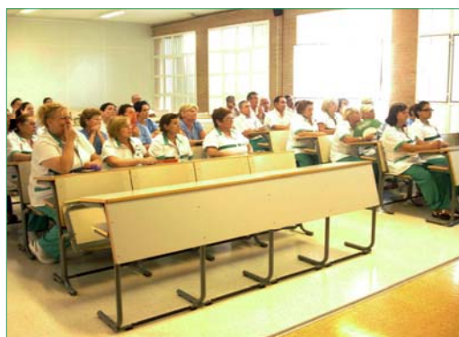
Los primeros participantes en las charlas han sido los ordenadores de aparcamientos y las trabajadoras de la UAL.